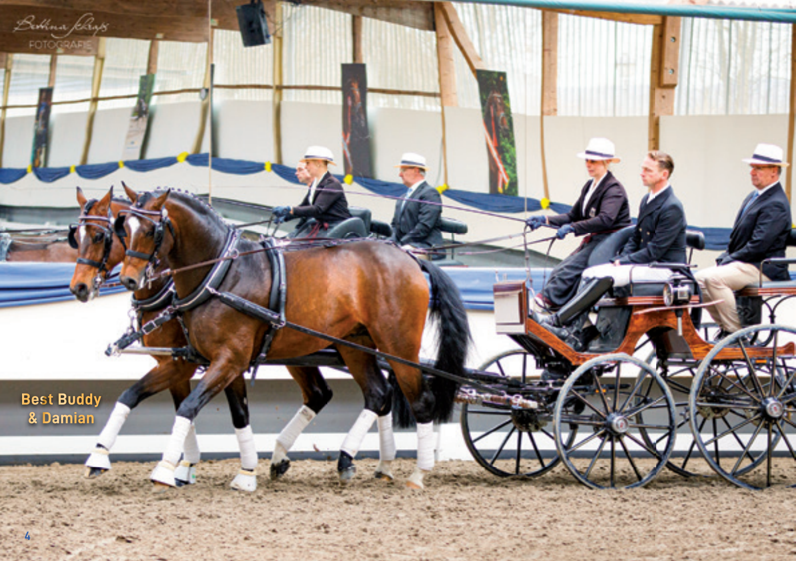
Best Buddy & Damian